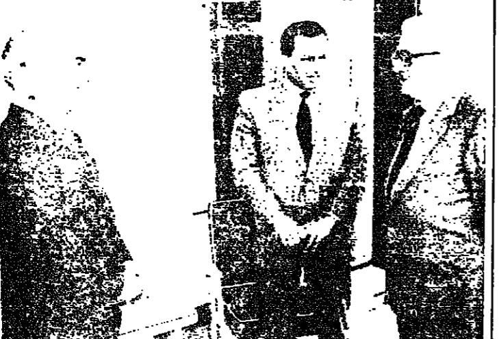
مبارك يتوسط الحسين وعزيز قبل اجتماعهم في الاسكندرية

وهذا هو اول تعليق سوري رسمي عن النزاع الدائر بين العراق والكويت. من جانبها نفت الكويت الاتهامات العراقية بأنها تسعى الى تحويل الخلاف بين البلدين. وكان العراق قد اتهم الكويت بتعميد السبيل لقوى اجنبية للتدخل في المنطقة، بعد ان سلم لكويت الكويتي في الامم المتحدة رسالة بشأن الخلاف في الامين العام للامم المتحدة هانز بييريس دي كوير. واعلنت الكويت ليلة امس الاول انها لم تطلب اتخاذ اي اجراء دولي من قبل الامم المتحدة في ما يتعلق بالتطورات الاخيرة بينها وبين العراق.